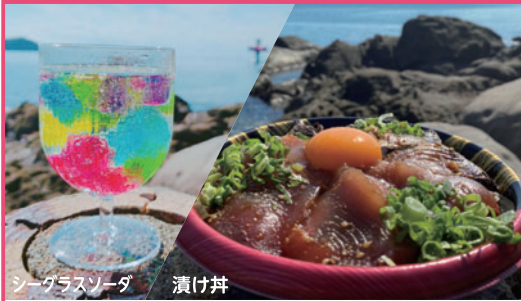
シーグラスソーダ 漬け丼